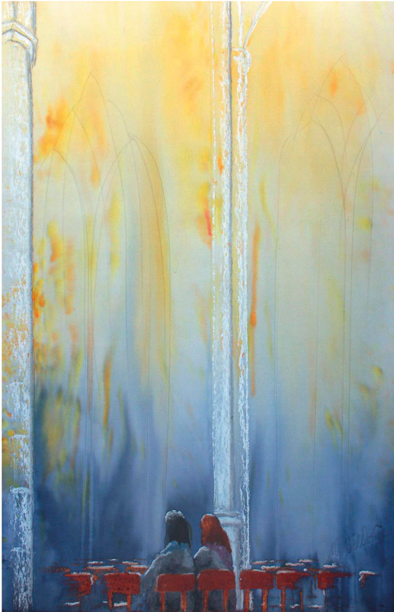
Bild: spirituelle Kunst von Michael Willfort, Galerie: www.kunst2day.de

Wo es finster bestellt ist in uns selbst, in der Kirche und in dieser Welt, sehnen wir uns nach dem Licht.